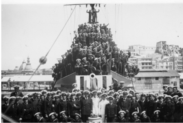
Destructor Almirante Valdés. España. Ministerio de Cultura y Deporte. Centro Documental de la Memoria Histórica