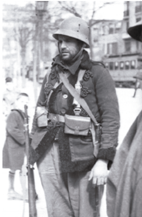
Movilización general frente al edificio de Telefónica. Madrid.