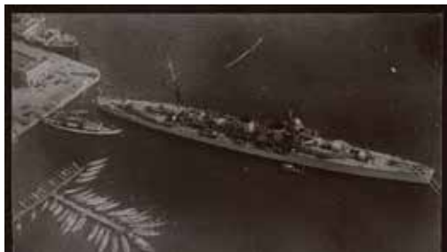
Acorazado España.