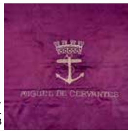
Banderín Quinta Compañía de marinería. España. Ministerio de Defensa. MNM 4963