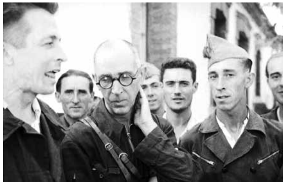
General Mangada.

Tal y como estaba previsto, la sublevación comenzó el 17 de julio de 1936 en el Protectorado Español de Marruecos. Al día siguiente, el general Francisco Franco volaba de incógnito desde Canarias a Tetuán para dirigir los movimientos de la pieza clave del pronunciamiento: el Ejército de África. Las horas y días siguientes fueron decisivos para el triunfo o fracaso del golpe. El plan diseñado por el General Mola se puso en marcha y la rebelión militar estalló simultáneamente en la Península.