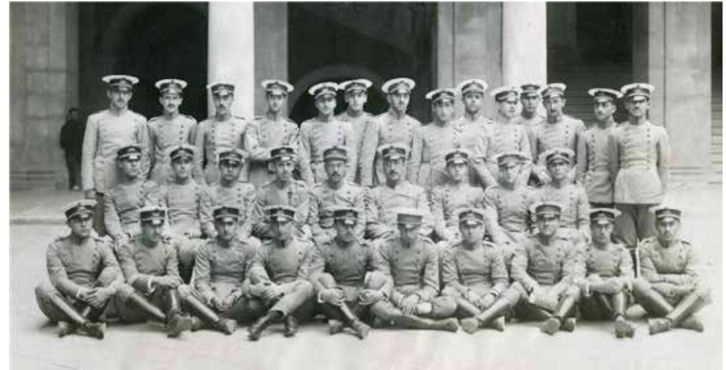
Academia Infantería Toledo, promoción 1912.