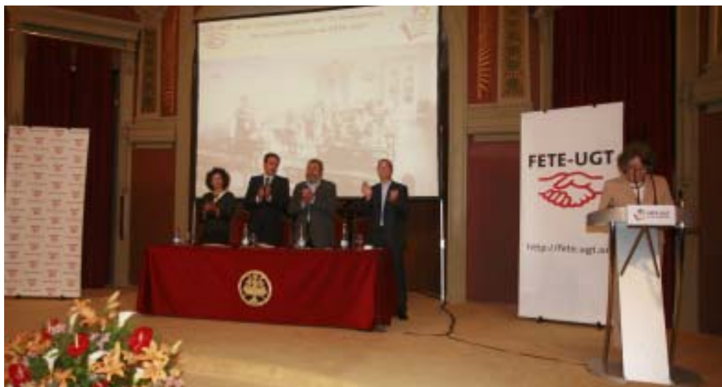
Cabrera, Rodríguez Zapatero, Méndez, y Rosa María Mateo en el acto de FETE

El número de mujeres atendidas en las unidades de orientación laboral gestionadas por UGT Andalucía duplica al de hombres (68% son mujeres frente a un 32% de hombres), una cifra que supone un fiel reflejo de las desigualdades de género en cuanto al empleo, ya que el paro femenino es una característica del mercado laboral andaluz. Según un informe elaborado por la Secretaría de Empleo de UGT Andalucía, el tramo de edad más habitual entre los usuarios del programa Andalucía Orienta se sitúa entre los 25 y los 45 años, seguido de los menores de 25.