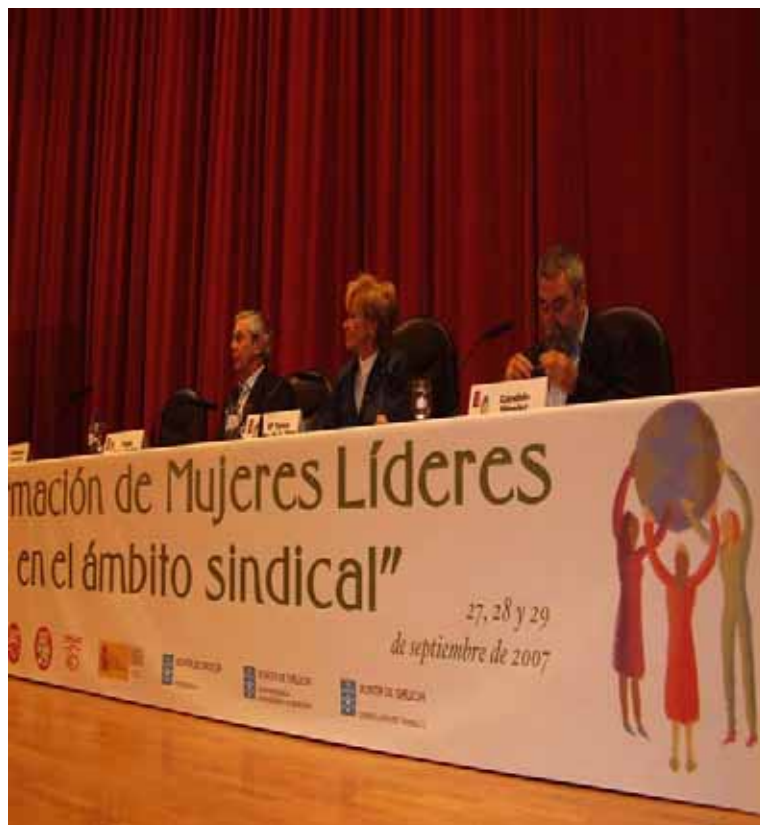
El presidente de la Xunta de Galicia, Emilio Pérez Touriño, la vicepresidenta del Gobierno, María Teresa Fernández de la Vega, y el Secretario General de UGT, Cándido Méndez.